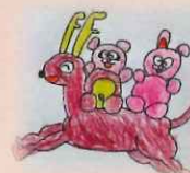
イラスト 山本俊太