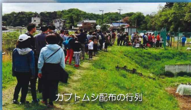
カブトムシ配布の行列