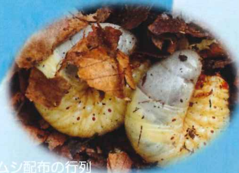
カブトムシ配布の行列