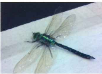
クロスジギンヤンマ