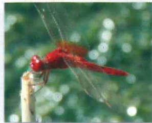
ショウジョウトンボ