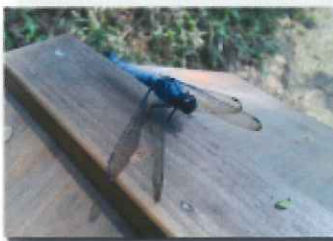
オオシオカラトンボ