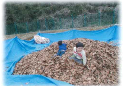
わーい 落ち葉プールだー

29年度は田植え、畑では緑肥作物としての大麦栽培、ジャガイモ掘りなどを終え、ラッカセイやサツマイモなどは秋の収穫に向けて取り組んでいます。農業は種まき、移植、収穫まで3~6か月かかります。その間に除草、土寄せ、追肥など生育に合わせての作業が続きますから、毎日の取り組みが大切で、まして肥料分のない畑での栽培は困難が伴います。自然の恵を享受できるようになるまでには、根気と努力が必要です。