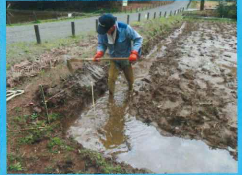
竹板を差す溝を掘る作業中