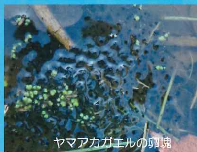
ヤマアカガエルの卵塊