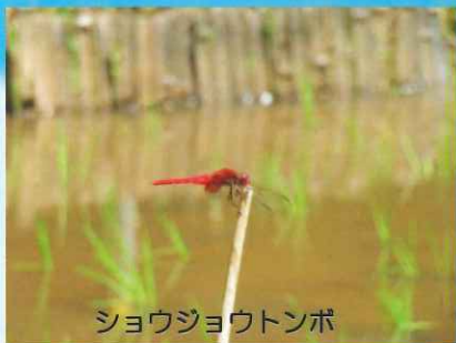
ショウジョウトンボ