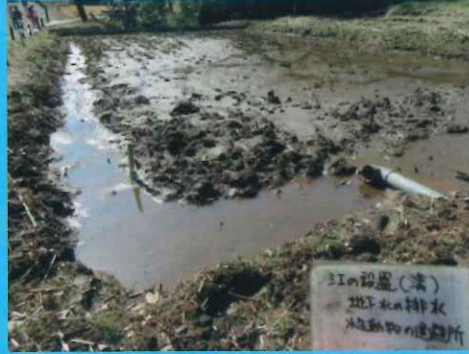
排水口が田表と同じ高さになっている