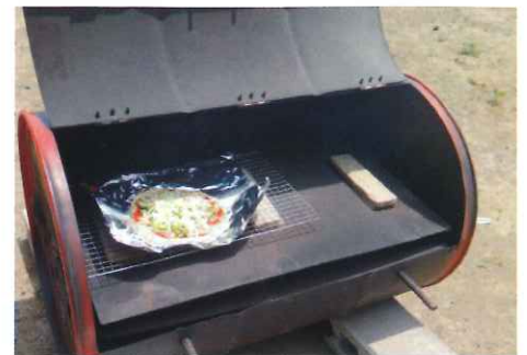
ドラム缶でピザ焼き5月実施、9月にも予定