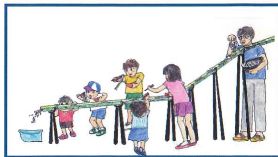
そうめん流し(8月予定)