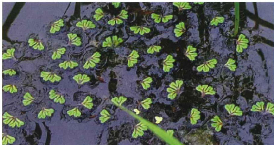
イチョウウキゴケ