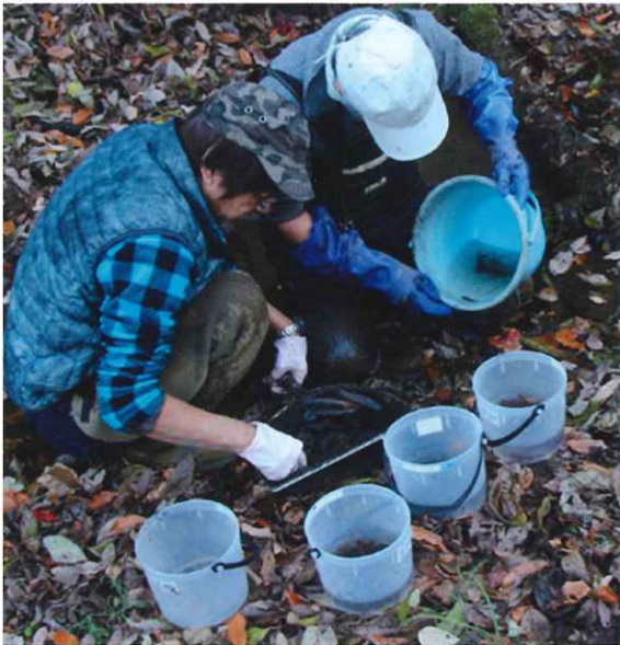
捕れた生き物を仕分ける