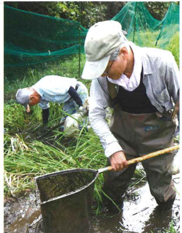
田んぼの生き物調査